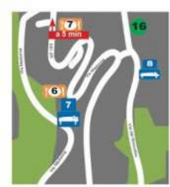
Borgo di PRESTINE